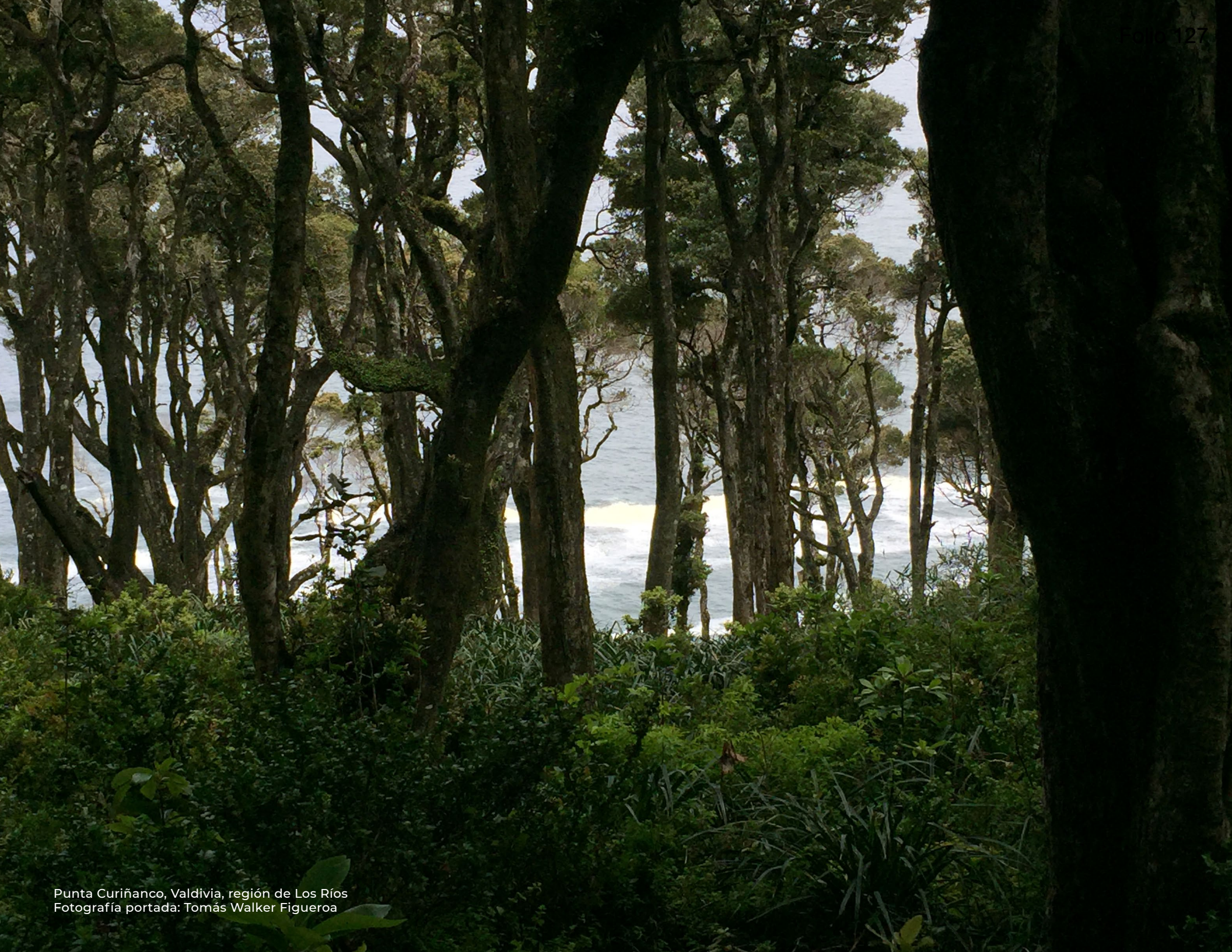
Punta Curiñanco, Valdivia, región de Los Ríos